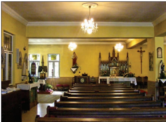
2. kép. Rákospalota-Kertvárosi Árpád-házi Szent Margit-templom belülről (D. F. M.)

hitélet újabb fellendüléséről, a háború után újjászervezett egyesületek megerősödéséről és a közösség anyagi helyzetéről számolt be. A szükségképpén három 120 cm-es – Jézus Szíve-, Szűz Mária-, Szent József- – szobrot vásároltak, oltárterítőket, miseruhát stb. vettek, gyűjtöttek keresztútra és harmóniumra is. A kápolnát a perselypénzből fenn lehetett tartani. Az egyházadót önkéntes adományként kezelték a korábbi határozat értelmében. Ebből csak 10%-ot vontak le a pénzbeszedők díjazására, a többi a templom-építési alap részét képezte. A lelkész, a kántor, a harangozó a továbbiakban is ingyen végezte munkáját.