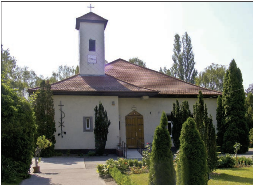
1. kép. Rákospalota-Kertvárosi Árpád-házi Szent Margit-templom